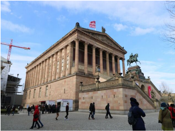
Abb. 3 Alte Nationalgalerie Berlin

ließen die deutsche Geschichte und ihre tragischen Wendungen in anschaulicher Weise erfahrbar werden. Den Abschluss bildete eine mit Taschenlampen ausgerüstete Erkundungstour durch einen abgesperrten und stillgelegten Tunnelbereich, im Zuge derer inmitten urbanen Alltagstreibens plötzlich das Gefühl vollkommenen Verlassenseins aufkam.