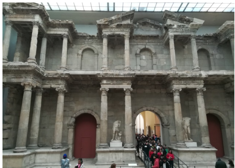
Abb. 4 Rekonstruiertes Markttor von Milet im Pergamonmuseum

Die Besichtigung der Alten Nationalgalerie sowie der Ausstellung des Pergamon Museums standen erneut ganz im Zeichen historischen Bewusstseins: der Inszenierung von Geschichte. Beeindruckende Tempelfragmente waren hier für die Teilnehmer*Innen zu beschauen. Anhand der dazugehörigen Infotafeln lässt sich die Kontextualisierung entsprechender Spuren der Geschichte erschließen. Die Darstellung