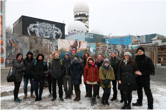
Abb. 1 Gruppe bei Radarstation Teufelsberg.

Nutzung“ als Plattform für Street Art. Qualitativ herausragende, überproportional dimensionierte und überaus intakte Graffiti-Kunst kontrastierte somit auf augenscheinliche Weise mit der nicht mehr intakten Gebäudestruktur. Vor allem die Form der freien Bewegung innerhalb des Geländes, die nach Entrichtung eines durch den Projektrat geförderten Eintritts möglich war, erweckte die Abenteuerlust der Partizipierenden. Der starke Kontrast von Verfallsästhetik und künstlerischer Projektionsfläche lud die Teilnehmer*Innen zur Dokumentation des Vergänglichen ein.